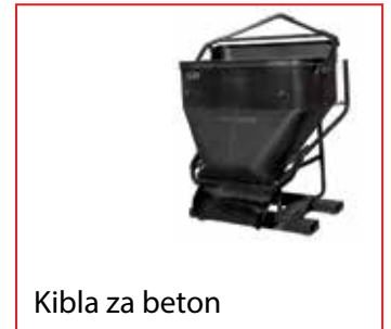
Kibla za beton