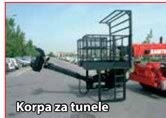
Korpa za tunele