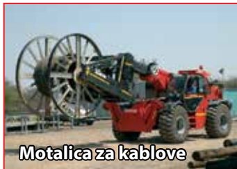
Motalica za kablove