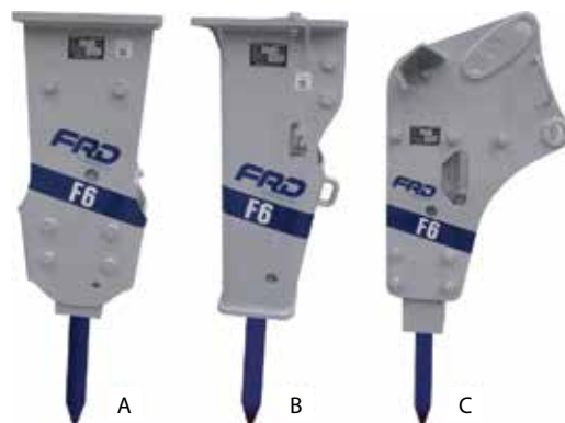
A: Standardni ram za kačenje čekića putem brze spojnice (F6) B: Ram za smanjenu buku (LN) za kačenje čekića putem brze spojnice C: Specijalni BHL ram za kačenje čekića na rovokopač utovarivač