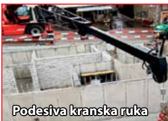
Podesiva kranska ruka