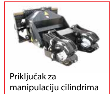
Priključak za manipulaciju cilindrima