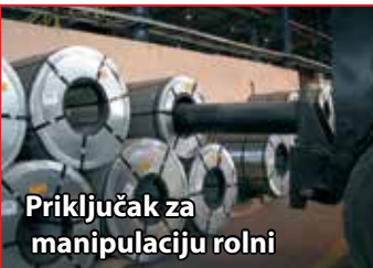
Priključak za manipulaciju rolni