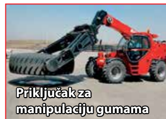
Priključak za manipulaciju gumama