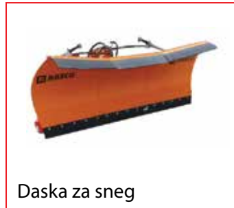
Daska za sneg