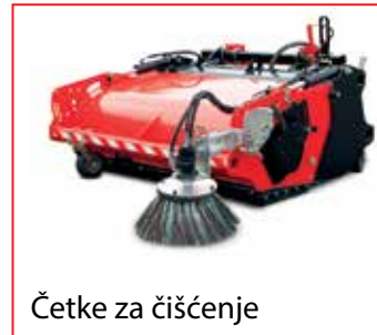
Četke za čišćenje