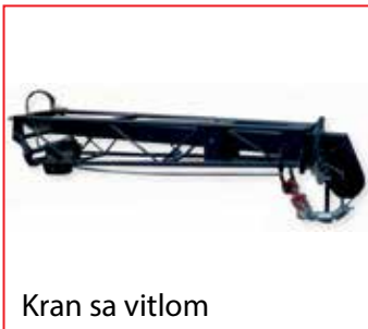
Kran sa vitlom