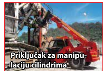
Priključak za manipulaciju cilindrima