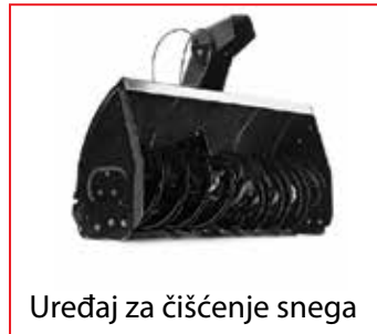
Uređaj za čišćenje snega