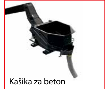
Kašika za beton