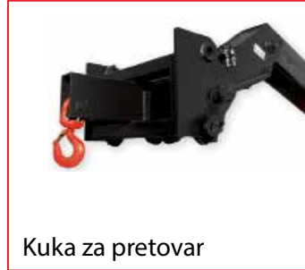
Kuka za pretovar