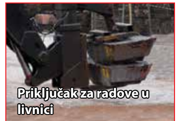
Priključak za radove u livnici