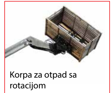
Korpa za otpad sa rotacijom