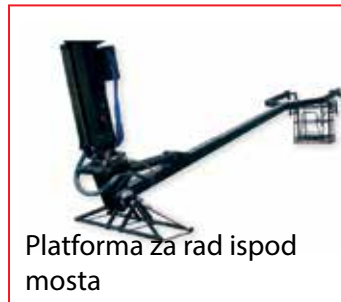
Platforma za rad ispod mosta