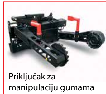
Priključak za manipulaciju gumama