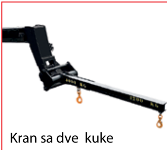
Kran sa dve kuke