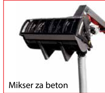
Mikser za beton