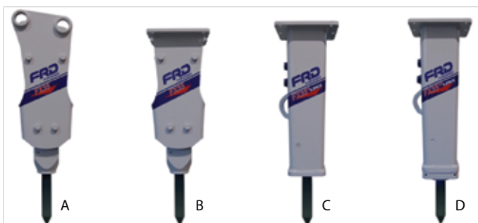
A: Standardni ram za kačenje čekića putem bolcnova B: Standardni ram za kačenje čekića putem brze spojnice (FT) C: Ram za tihi rad za kačenje čekića putem brze spojnice (S) D: Ram za ekstremno tihi rad za kačenje čekića putem brze spojnice (XS)